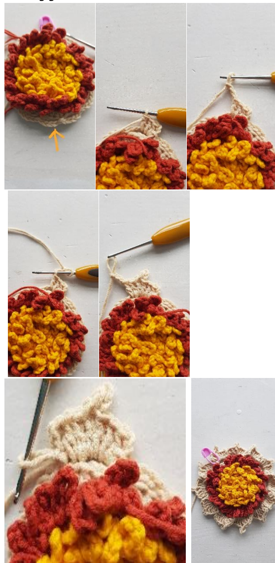
Foto 1: Lossenboogje zie pijl. Foto 2: 3stk. Foto 3 – 4: Picot. Foto 5: 3stk. Foto 6: Blaadje volledig gehaakt. Foto 7: Bloem volledig gehaakt.

lossenboogjes herhalen vanaf *, 1hv in de hv waar deze toer mee begonnen is. Hecht draad af. (12 blaadjes)